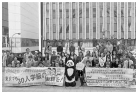
10月23日(日)立川駅頭で「ゆきまじ」いた教育