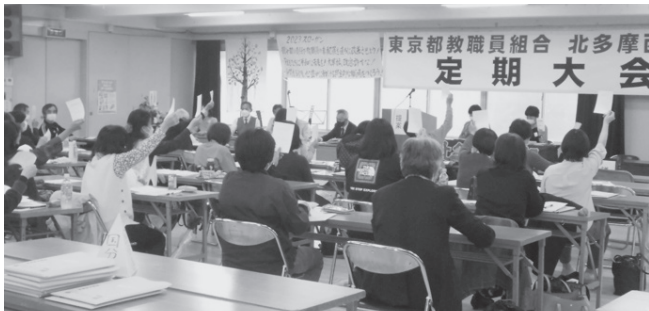
昨年度の定期大会の様子