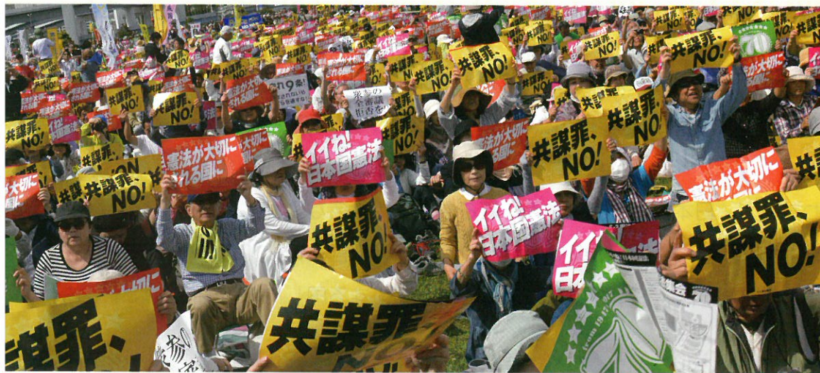
2017年「施行70年、いいえ！日本国憲法5・3集会」5万5000人参加（東京・有明防災公園）

“安倍9条改憲”反対の一点で手をつなぎましょう。3000万人の「戦争はイヤだ」の声を集めて、9条を未来につないでいきましょう。